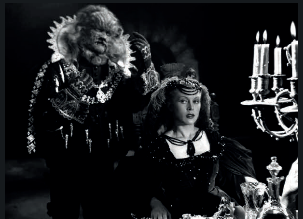
La Belle et la Bête, Jean Cocteau, 1946

La lumière artificielle fait référence à toute lumière créée par de l'énergie électrique. Elle peut être produite par toutes sortes de sources de toutes les couleurs.