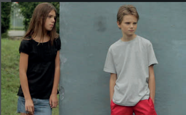
Tomboy, Céline Sciamma, 2011