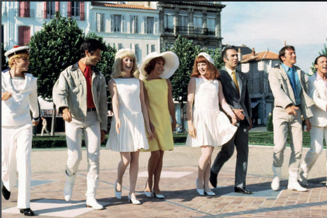
Les Demoiselles de Rochefort, Jacques Demy, 1967

C'est pourquoi l'éclairage est un aspect technique et artistique important à prendre en compte pour le rendu visuel de ta prise de vue. Voici les principaux éléments que tu dois savoir. Il existe trois sources de lumière différentes :